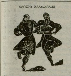
პართული სანგაკარი ფოკლორი