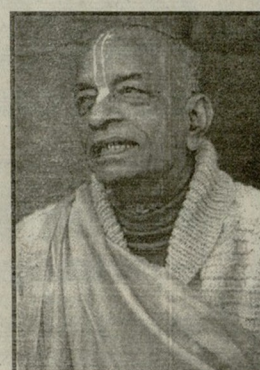
კრიშნა - რაინეჟმ ჩანდრა მოჰანი