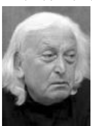
სავლეთის თვალწინ. ურთიერთის მიმართ დაგროვილი განწყობა იზრდება. პატარა ნაპერწკალი და ხანძარი აგიზგიზდება. ვინ იცის, იქნებ მათი ხელის მოსათობად? პაპიავიტ ჭიპაპილი, პოლიტიკოზი.

ანტირუსულ პროპაგანდაზე აგებული თავგადარჩენის ნაცური პოლიტიკა ზენიტშია. მიზნის მისაღწევად საქარო საზოგადოების გახლენა, დაპირისპირება, ერთმანეთზე გადაკიდება. და ყოველივე ეს „ბრძენი“ და-