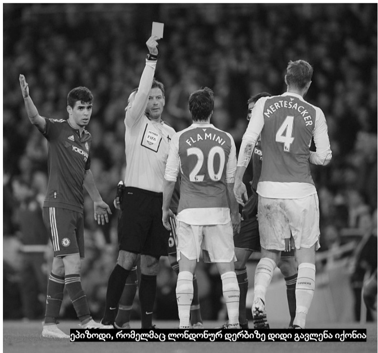
ეპიზოდი, რომელმაც ლონდონურ დერბიზე დიდი გავლენა იქონია