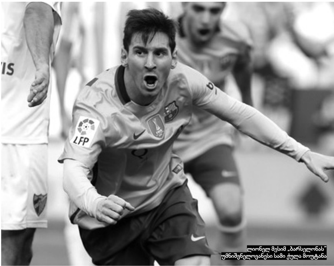
ლიონელ მესი „ბარსელონას“ უმნიშვნელოვანესი სამი ქულა მოუტანა