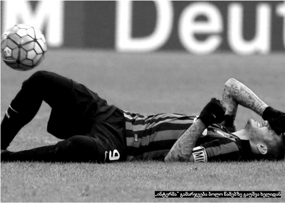
„ინტერმა“ გამარჯვება ბოლო წამებზე გაუშვა ხელიდან