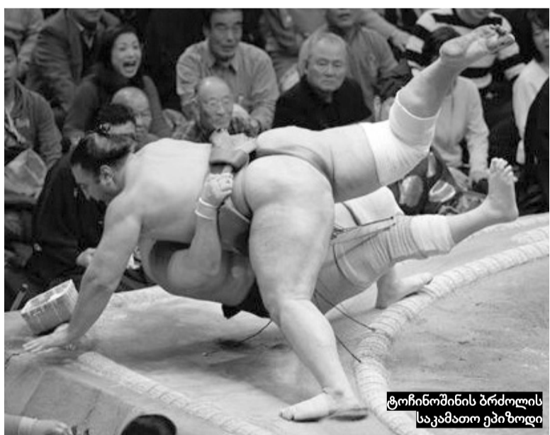
ტოჩინოშინის ბრძოლის საკამათო ეპიზოდი

12-3: ჰაკუშო (იოკოძუნა), ჰარუმე-ფუჯი (იოკოძუნა), ტოჩინოშინი (მაე-გაშირა 7)