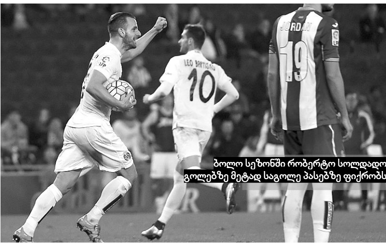
ბოლო სეზონში რობერტო სოლდადო გოლებზე მეტად საგოლე პასებზე ფიქრობს

ლო 4 მატჩში „სევილიამ“ 5 ნითელი ბარათი „დაიმსახურა“. * ალვარო ნეგრედომ ბოლო ნაშე გატანილი გოლით „ვალენსიას“ დეპორტივოსთან საგარეო ქულა გადაურჩინა. ლაკურუნიელებთან 6 სტუმრობისას ნეგრედოს 5 გოლი უგროვდება. * „ვალენსიას“ უკვე 10 ტურია არ მოუგია, ეს არის ყველაზე დიდი მოუგებელი სერია 1986 წლის მერე, როდესაც „ლამურებმა“ 13 ტური ჩაატარეს გამარჯვების გარეშე. * ალვარო სეზუდო ნოლიტოს მერე გახდა მეორე ფეხბურთელი, რომელმაც საჯარიმოს გარედან გაუტანა „რეალს“. * „ბეტისი“ ერთადერთი კლუბი იყო, რომელიც პირველი გოლის გატანის შემთხვევაში აუცილებლად იგებდა. „რეალთან“ სევილიელებმა მატჩი გამარჯვებამდე ვეღარ მიიყვან-