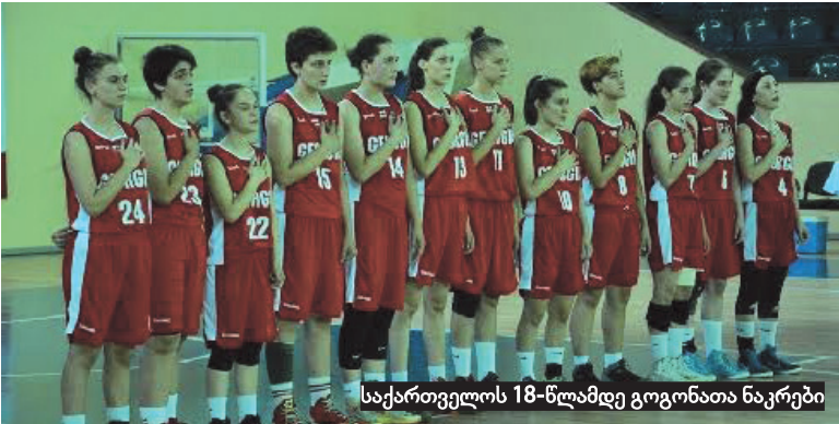
საქართველოს 18-წლამდე გოგონათა ნაკრები