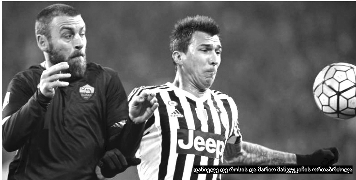
დანიელე დე როსის და მარიო მანჯუკიჩის ორთაბრძოლა

რედი გარსიას თავკაცობით, „რომას“ არასდროს უთამაშია 3-4-1-2 სქემით, სპალეტტი კი სწორედ ამ ტაქტიკაზე შეაჩერა არჩევანი. დანიელე დე როსი დაცვის ცენტრში გაამწესა და ამ უკანასკნელმა შესანიშნავად ითამაშა და პრაქტიკულად ყველა ორთაბრძოლა მოიგო. ამასთან, დირიჟორობდა დაცვის თამაშს და შეტევებსაც ხშირად იწყებდა. კიდევ ერთი მნიშვნელოვანი პერსონა მირალემ პიანიჩი გახლდათ, რომელიც საყრდენი ნახევარმცველის პოზიციაზე ირეგულარად და თამაში მიჰყავდა. როგორც თვითონ იტალიელები ამბობენ, პიანიჩმა რეჯისტრას (რეჯისორი) როლი მოირგო და საქმეს თავი კარგად გაართვა. მოკლედ, სპალეტის რამდენიმე ნაბიჯი იტალიურ სპორტულ მედიაში დადებითად შეფასდა. აი, რაჯა ნინგოლანი ს გამთამაშებლად გამწესებამ კი დიდად ვერ გაამართლა - ბელგიელი უფრო მეტ-