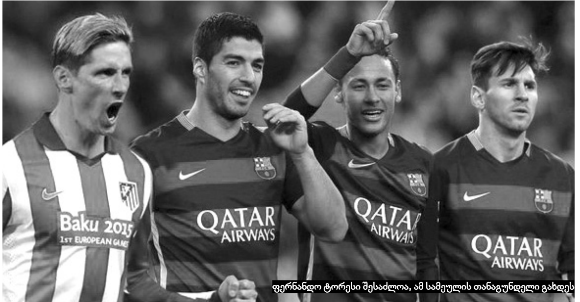
ფერნანდო ტორესი შესაძლოა, ამ სამეფოს თანაგუნდელი გახდეს