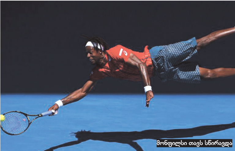
მონფილსი თავს სწირავდა

ავსტრალიის ღია პირველობის განთავსება ტოპ-ოთხეულს პირველი წევრი გამოაკლდა. მელბურნის კორტების 2014 წლის ტრიუმფატორმა სტენ ვაგინკამ ვერ გაიარა მერვედფინალის ბარიერი. მან ხუთსეტიანი თრიბლი დათმო კანადელ მილოშ რაონიჩთან , რომელსაც 2016 წლის სეზონში რვიდან რვა მოგება აქვს. ჩრდილოამერიკელისგან დიდი ხანია ელოდებოდნენ უკვე კარგა ხნის წინ გაცემული ავანსების გამართლებას და, შესაძლოა, ეს სეზონი გარდამტეხი აღმოჩნდეს. რაონიჩმა წლის დასაწყისში ბრისბენის ტურნირი მოიგო, თან ფინალში როჯერ ფედერერი დაამარცხა, გუშინ კი მეორე შევიცარიელი ვარსკვლავიც ჩამოვიცა გზიდან. შეხვედრა სამი საათი და 44 წუთი გაგრძელდა, რომლის დროსაც მილოშმა 82 „ვინერსი“ და 24 იისი შეასრულა და 6:4, 6:3, 5:7, 4:6, 6:3 მოიგო. ეს ამ ჩოგბურთელთა მესამე შეხვედრა იყო და კანადელმა პირველად დაამარცხა შევიცარიელი.