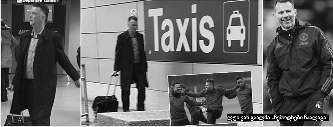
ლუი ვან გაალმა „ჩემპიონები ჩააბარა“

„საუთჰემპტონთან“ 0:1 სა- შინაო მატჩის შემდეგ, ლუი ვან გა- ალმა ჩემპიონები ჩააბარა და ჰო- ლანდიაში დაბრუნდა, ვიხილავთ მას ისევ „იუნაიტედის“ სათადარი- გოთა სკამზე? „დეილი მელი“ ეჭ- ვობს, რომ აღარ.