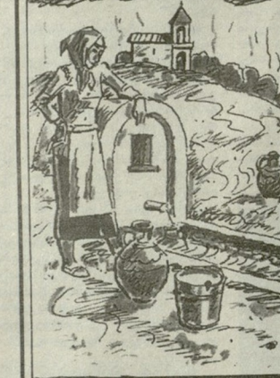
„ძალაის კლუბი“ მხატვარი მღაზარდ ამბოპაძე.