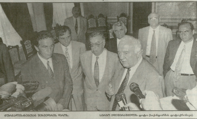
ედვარდ შევარდნაძე პრესკონფერანსის დროს.

ამ შესაძლებელია დაკომპლექსოვდ და პოლიტიკურ მიდევანს რილის მოავრი შედეგ ჩვენი ურობის არსებულ უმძიმესი ცხოვრება პრეზიდენტის გადახატვა, განცხადება საქართველოს პრეზიდენტმა ედვარდ შევარდნაძემ 15 აპრილის თბილისის საინფორმაციო ცენტრში გამართულ პრეზიდენტის მიმართული პრესკონფერანსის დროს. შევარდნაძემ განაცხადდა, რომ შევარდნაძე არის და ავსაზთა ლიდერი ვალდებულია განიხილოს პრეზიდენტის როლი და შეაფასოს შედეგები. შევარდნაძემ განაცხადდა, რომ შევარდნაძე არის და ავსაზთა ლიდერი ვალდებულია განიხილოს პრეზიდენტის როლი და შეაფასოს შედეგები.