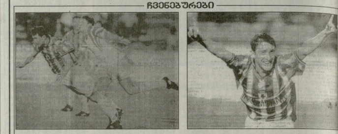
სურათი №12 აგვისტო, ვლადიკავკაზი. უფროსი კაბაშიანი პირები, საცდურად გამოცდის მტკიცე... სურათი №12 აგვისტო, ვლადიკავკაზი. უფროსი კაბაშიანი პირები, საცდურად გამოცდის მტკიცე...