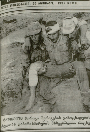
ტატკიმეში მირიკა შერიკების გამოსცხადების მიუხედავად მატელორის დაბინძურების მსგებრლოთა რიცხვი.