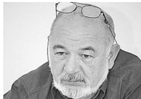
ან „ქართული ოცნების“ გუნდის ახალი წევრები?

– კონკრეტულად არ ვიცი, მაგრამ რომ ვიცოდებ, არ მაქვს უფლება გარკვეული გვარები გავაუღლო. ვიცი, რომ ბევრ ადამიანთან არის კონსულტაციები და ეს იცის ყველამ. საქართველოა, ვიღაცა ვიღაცის ნათესავია, ვიღაცის ახლობელია და დაახლოებით, იცის ხალხმა, როგორ ადამიანებს არჩევდნენ. შეიძლება ვიღაცას არ მოეწონოს და თქვას ცნობადი სახე, ან საყვარელი ტიპი რატომ არ არისო.