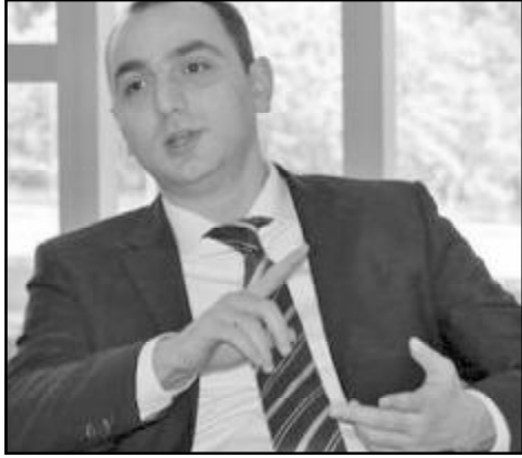
ვიხილავთ ყველა მნიშვნელოვან ეკონომიკურ საკითხს... იმედს გამოვთქვამ, რომ თებერვლის პირველივე კვირაში მოხდება ეროვნული ბანკის ანგარიშის მოსმენა.

არადა, თავად ეროვნული ბანკის პრეზიდენტი გიორგი ქადაგიძე სხვა აზრისაა. იგი გაკვირვებულია იმის გამო, თუ რატომ არ სურთ დეპუტატებს ანგარიშის მოსმენა, მით უმეტეს, რომ, „ეროვნული ბანკის“ ყველა პროგნოზი გამართლდა. პოსტსაბჭოთა ქვეყნების წარმომადგენლები საქართველოში გამოცდილების გასაზიარებლად ჩამოვიდა. ამიტომ ეს (პარლამენტი – ო.ტ.) უნდა იყოს მთავარი ტრიბუნა, სადაც გან-