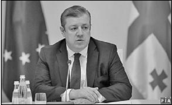
მომადგენლებს, რომლებსაც გუშინ მთავრობის ადმინისტრაციაში უმასპინძლა.

ლების ჩართულობა ჩვენი გადაწყვეტილებების მიღების პროცესში კიდევ უფრო მაღალი იყოს. მინდა, ვისაუბროთ გულწრფელად, გულანდილად ყველა იმ საკითხზე, რომელიც ჩვენთვის აქტუალურია, – განაცხადა პრემიერ-მინისტრმა. პრემიერმა არასამთავრო-