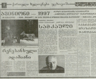
საქართველოს პრეზიდენტის პრემიერი

ჩვენ განვითარდებით ვართ ჩვენი თანამედროვენი. ჩვენ ვართ ჩვენი თანამედროვენი. ჩვენ ვართ ჩვენი თანამედროვენი.