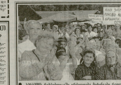
სსრკ-ის რესპუბლიკაში ერთდროულად მიტანეს რადიკალური მხარდამსახურება

რუსეთის პირსხვის დანა-ჩანგალი წამოღება ეპონომიას? რუსეთის პირსხვის დანა-ჩანგალი წამოღება ეპონომიას?