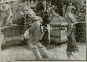
შობიარული ტურისტები - რომის ლიუს უსანიონაროპატა რისხვა