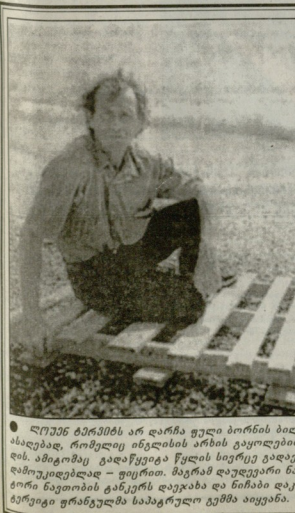
ღიმიან ბრძენის არ დარჩა უფრო სიბერის ბილიონის ანაბედა, რომელიც ინგლისის არმიის გაყვალბათ და...