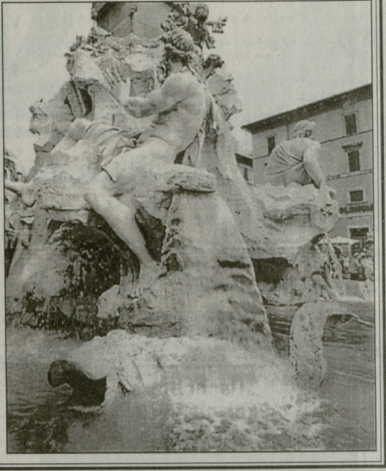
სოკოი წყალს მიამქვს