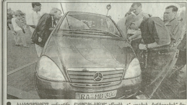
საბავშვო კონკრეტული „დაიპლმა-ბენი“ იყვებს „კლასის მფარველის“ მიმართული წარმომადგენელი ავტომობილის ბაზრზე გადის...