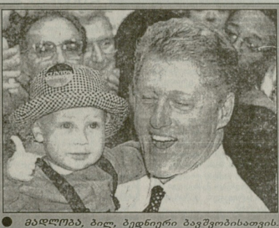
მამლიბე, ბილ, ბედნიერი ბავშვობისთვის.