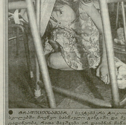
ტრავმისგან დაზარალებული, 1 სექტემბერს ტოკიოს სკოლაში მოუხერხებულად გატარებული და მკურნალობისას...