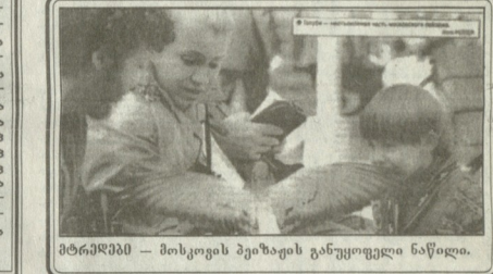
მტრეკმა - მოსკოვის ვეზაფის განყოფილება ნაწილი.