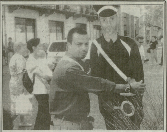
იტალიის ქალაქ სერაგელს (ტურინის გარეუბნის) ხელისუფლებმა თავზნებლაღებულ მქოლებთან ბრძოლის ფრად ირინიარული ხევის შექმნა. ახლა, ქუჩაში ყველაზე იდგება დამხრუქება, - მანინა სერაგელის მერს ჯანდელ ბინანის, რომელიც ამ სერაგელს ხის "ეკოტინსექტორთან" ერთად დგას.