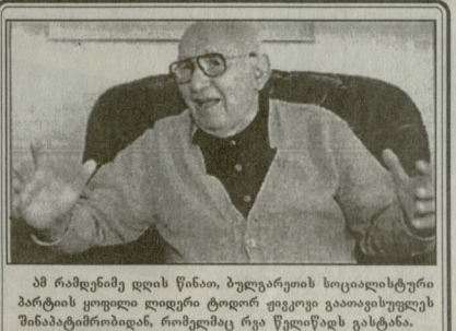
ამ რამდენიმე დღის წინააღმდეგ, ბუღალტრის სოციალისტური პარტიის ყოფილი ლიდერი ჯორჯი ურგოვი გათავისუფლებულია შინაგანსამართლებიდან, რომელიც რვა წელიწადს გასტანდა.

ზინბაბაძის დედაქალაქი პარალელ დინყო ქვეყნის ყოფილი პრეზიდენტის ქანაძის ბანანის გასამართლებს. მას ბრალად ედება, რომ აიძულებდა სექსობრივი კავშირის დაქვრის თავის. ყორჩაბი.