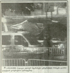
საგარეო უწყვეტი მსოფლიო კავშირების მინისტრის დანიელ ლუგუაძის კარგის ფოტოგრაფია