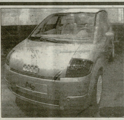
შპსმა 2111 კვადრატული მეტრი დაიწყო, იხილა იხილა ეპილოში.