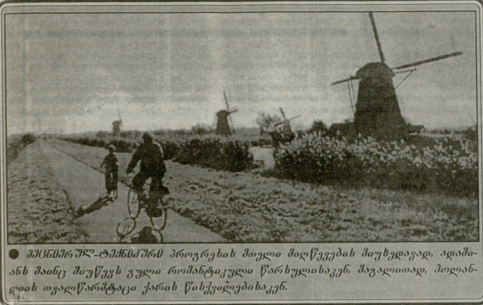
● მდინარეზე ტანისშენი პროგრესი მთელი მარცხების მურქედავ. ადამიანს შანი მურქე უკლი რამდენიმე წარსულიდან. მკვლელად, პოლანდის თვალწარმტვი კარის წარმდგომიდან.