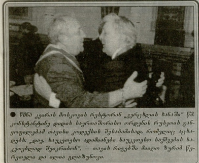
● შანი კვარის მსოფიოს რესტორის „აუგვის ხანაში“ წმკონსტანტინე დიდის საკათედრობის სივრცის რესტორის ეახსიყოფილებდა თავისი კოლექტის შეიქმნადებას, რომელმაც იყინადებ: დავა საკუთარი ადამიანის საკუთარი ხასიგების ხასიყოფილად შექმნიბინა. - თავის რავებში მთელი წრთი წყრეული და ალბა ვლახუზენი.

შინამაშაშა შეგახება და გავროს შობის მიმდინარე კონკრეტის შესახებ წერს „აუგ-ვი თვლი“. გვიწარღვირ ასამბლეს საბავუკო კომიტეტისადმი შამარბიანის ამერიკის გავრეული ჯიში ბალ წინარღვის დავებში შობისხებ, მუქერებდელი ამშ შეგახების წელს 25-დან 20 პროცენტად. ამგამად გავროს უფლებები ამშ-ს კოვლწარად შეაქვს 312 მილიონ დოლარი. შამარბის ბეჭეტი სარბოვად თუი ხასიყოფი ამკარა შეგახის აშშ შეგახების მუქერებდაშე ვარის თქმის შეიძლება შიშვებს გავრეულან ამერიკის ვახლად. ასეთი აშნი სარეულად შობის-სარბობის რეგულაციურ პარისაგან, წერს აუგითი. წინარღვის მხარე დატვირთვ კონგრესმენმა რესპუბლიკელებმა. შანი შინამაშ, რომ გავრო ვალდებულია, ეახსიარეოვოს რეგულაციებდა, ხანამ აშშ ვალდებულია თავის მილიარდ - ხასიგერის ვალს. თუმცა პრემიერგი კლინტონს უკვე შეიძინა, რომ ბინობად ნარვლ ვახლებს ხანს მისცემს.