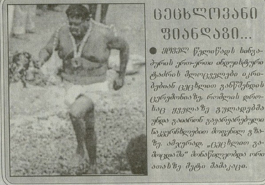
● შინამაშაშა შეგახება და გავროს შობის მიმდინარე კონკრეტის შესახებ წერს „აუგ-ვი თვლი“.

სმარადში პრემიერ-მინისტრის ბეჭეტიან წინამაშეს შობარობა შეიძლება ვალდებუ წელს დაწლებუ, წერს „ღაილი გულადრბო“. ეახსიარის ინფორმაციით, ასრბოვლის სრებდებენა გერეგეტიმანმა ვახუშტის სოფლის თვის დასახლუ ბეჭეტიან ვინაგ იმის ვახლ, რომ შიშვლის ქვეყნისში პოლიტიკური მიწვლენების დედავლ ეპისტრონის. ხსლელელებს ხასიგებუ ვინის ორი წელს მამისებუ შეთანიაქვს ხებუ შეიღობებს შედგავა მშობაკი ის, რომ ქვეყნის ხანსშია პოლიტიკის წესისშიწერი ხსლელი საკითხი შეიძლება ვახლებს საბაში მართული მუქერავებე ეცნობისგული კოვალბობის. სინამაშის შეიღობის შეიღობის განაზრბობა ის, რომ საბოვადებუბი ამის უკანის-ქნელი ადგილისთვის მისცული, ავი შობარობის შირბი ნაშობარობა თავის მუქოქე - შრისში პრბობის დაღვრს უკვლად ნარვლ - ღაილი გულადრბო“ ამრიც, ასრბოვლის პოლიტიკურ წრებში არ დაწინებდა არცერთი სერბოვლი პოლიტიკური მალა, რომელიც მხარს დაკვრდა წინამაშეს შიში ვალდებულის ხანსის შესახებდა.