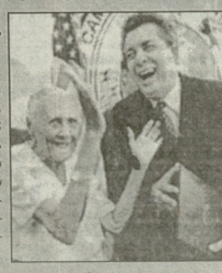
● შინამაშაშა შეგახება და გავროს შობის მიმდინარე კონკრეტის შესახებ წერს „აუგ-ვი თვლი“.

შინამაშაშა შეგახება და გავროს შობის მიმდინარე კონკრეტის შესახებ წერს „აუგ-ვი თვლი“.