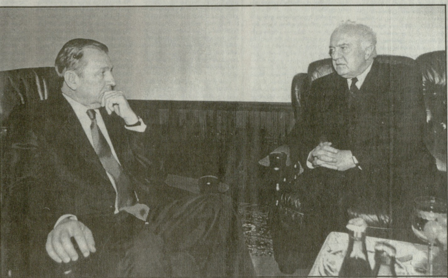
შხვაძე ვახტანგ პირველი