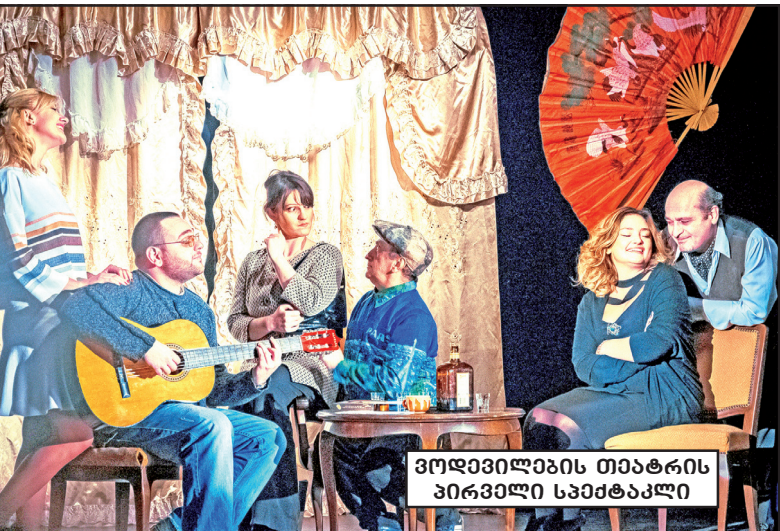
ვოდვეილების თეატრის პირველი სპექტაკლი