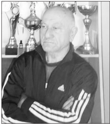
ოზურგეთის პროკურატურის თქმით, გადაწყვეტილება მიღებულ იქნება უზენაესი სასამართლოდან შესაბამისი განცხადების მიღების შემდეგ.