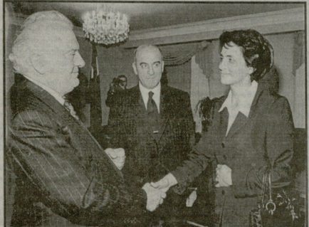
საქართველოს პრეზიდენტი ვიქტორ მუხომბაძე (მარჯვნივ) ვიქტორ მუხომბაძის (საშუალოში) და ვიქტორ მუხომბაძის (მარცხნივ) თანხვერისას.

ქალაქის წყარო ქვეყანაში სკანდინავიის ზღვარზე გადის მისი მთისგანა დაედა მთაბალოთ საქართველოს პრეზიდენტთან ვიქტორ მუხომბაძის 8 ნოემბრის გამართულ შეხვედრამ. შეხვედრა ურავლობა მთავრის რეგიონი სახელმწიფოთათმირის ურთიერთობის ინტენსივიკაციის, ახვე რეგონულ და საერთაშორისო ორგანიზაციებში თანამშრომლობის გაღრმავების აუცილებლობის. ვიქტორ მუხომბაძის მიანა, რომ საქართველო-ბულგარეთის თანხვერი ინტენსივისა და მსწრაფების გაზიზიცილებასათვის დადა ახალი ეგამი. ორმხრივი პარტნიორობის გაღრმავების, ვეროპულ სერქვერების ინტენსივის, „გრაესკას“ პროექტის აღრვი ამოქმედებისთვის საქართველო ნახავების გაღრმავების.