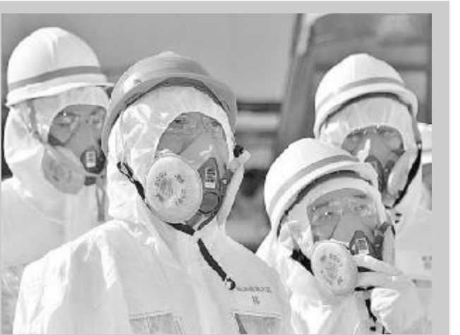
ბროცესში. ამის შემდეგ ქარხანა უნდა ამუშავდეს მთელი სიმძლავრით.

18 თებერვლამდე სანარმო იმუშავებს ტესტურ რეჟიმში, ვარაუდობენ, კერძოდ, შეამოწმონ, ხომ არ მოხდება რადიაციის გაუვნავა ფერფლის დაწვისა და გადაადგილების