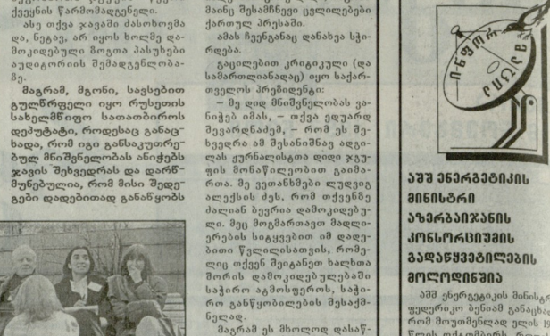
მეგობრთა ჯგუფის წევრები წარმომადგენელი...