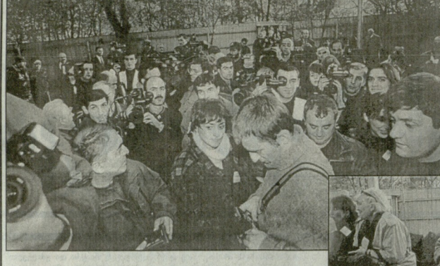
მეგობრთა ჯგუფის წევრები წარმომადგენელი...