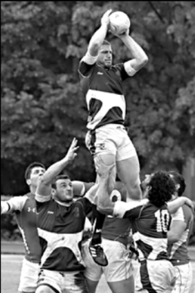
ცხადვე ცხადია და მათი უპირატესობა ახსენებდაც აშკარა იყო. „ლიონები“ 4 ლიონს და 2 რეალიზაციის შემდეგ...