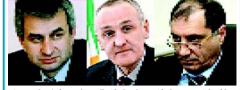
რა კოზირები აქვთ შამბას, ხაჯიმბას და ანჭვას

არქიმეას ცოლი გვ.6 ვისაპარაზიტებოვას უშივნებს