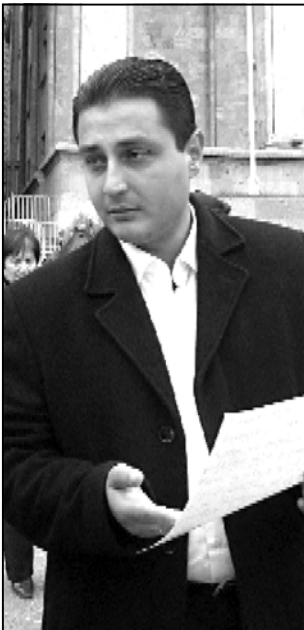
საკაშვილი ყველას ღიად დაუბრუნებდა

— ალტერნატივა დევნილებისთვის სრულიად მიუღებელია. შეთავაზებები ძირითადად სამეგრელოსა და კახეთის რეგიონში. თუმცა, ამ შემთხვევაში პრინციპული მნიშვნელობა აქვს რეგიონს. პრინციპული მნიშვნელობა აქვს იმას, რომ ადამიანებს სთავაზობენ აყვას და უპროსპექტივობაში გადასახლებას. სოფლებში კორპუსების ტიპის შენობა-ნაგებობებში, ყოფილ ფერმებში, რომლებს მდგომარეობა ძალიან მძიმეა, მაგრამ მდგომარეობას თავი რომ დაეცემოთ, თუნდაც კარგი შენობა-ნაგებობები რომ იყოს, ადამიანი საშუალო გარეშე ვერ იარსებებს. რადგან მას ელემენტარული საარსებო მინიმუმისთვის ნამდვილად არ ყოფნის 24 ლარაინი შემწეობა, რასაც დევნილები იღებენ. შესაბამისად, მაშინ, როდესაც ექვსჯერ მეტია საარსებო მინიმუმი, ადამიანებს აკარგავენ მთავარს მათი სიცოცხლის შენარჩუნებისთვის, აკარგავენ ბევრს იმ საშუალო ადგილებზე, რომელიც დევნილებმა მოიპოვეს საკუთარი ხელით. თვითდასაქმების გზით, თავად შექმნეს თავიანთი საშუალო ადგილები და ამით ირყინდნენ თავს და არჩენდნენ ოჯახებს. დევნილები არჩევანის წინაშე დგებიან ან იყვნენ უსახლკაროდ, ხან ერთ ნათესავს შეაფარონ თავი, ხან მეორეს და იცხოვრონ თბილისში ან მიმდებარე ტერიტორიაში, ან წავიდნენ და ჰქონდეთ ქვეყნიდან, მაგრამ არ ჰქონდეთ საკუთარი და შიმშილით დაიხოცონ. ეს არის რეალობა. ამიტომაც არ იღებენ დევნილები ამ შეთავაზებას. მათთვის, ხაზსასმით ვამბობ, თბილისში ცხოვრება არ არის ოცნება არც ახალგაზრდის არ ყოფილა, ისინი საკუთარი ნებით არ ჩამოსულან თბილისში. თბი-