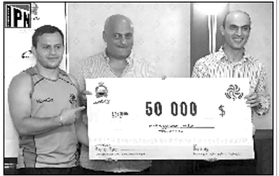
ღარიბთათა გამორჩევა. ეს არის წარმტებელი სპორტი, რომელსაც ჯენტლებში თამაშობენ. ამიტომ, კომპანია სიხის მისაღება იციის ისციი ნარებებს სპონსორი, როგორიც საქსიხველოს ნარებებია.

კომპანია „ნატახტარმა“ 15 იციბს, 20:00 საათზე, სახელო „ქოითიხე მახიოტში“ საქსიხველოს მოხატებთა ხიხვერე ნახეხთან შეხეხეხა გამათა და „პოხიჯალანსენს“ მეპიხიხული ჯილე გადასცა.