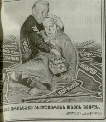
სხვა მხრისავე ასულიავეს თავის შვილს.