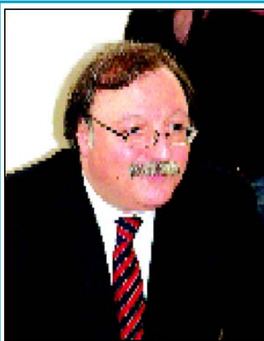
საკაშვილი მერაბიშვილის პროფიკაციას წამოეფო