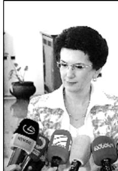
34 წლის ასაკში პრეზიდენტობა შეიძინა

„დემოკრატიული მოძრაობის“ ლიდერი ნირო ბურჯანაძის განცხადებით, 2008 წელს იგი პარტიის შექმნას ირაკლი ალასანიასთან ერთად გეგმავდა, თუმცა გეგმის განხორციელება ამ უკანასკნელის უარის გამო ვერ მოხერხდა. როგორც ბურჯანაძემ გუმინ სასტურრო „მყელ თბილისში“ გამართულ შეხვედრაზე ფურჩისტიტებს განუცხადა, მან ალასანიას პარტიაში მეროე კაცობა შესთავაზა. პარლამენტის ყოფილი თავმჯდომარის თქმით, არჩევნებში გამარჯვების შემთხვევაში მას პარლამენტის თავმჯდომარეობა არ სურდა და სპიკერის თანამდებობას ალასანიას სთავაზობდა, თუმცა შეთანხმება ვერ მოხერხდა. — ამ დროს მიხიელ სააკაშვილის ადრე ნათქვამი სიტყვები გამახსენდა: მას (ალასანიას) პრეზიდენტობა უნდაო. კარგად მახსოვს იმ დროს მე და მისმა ბერი ვიკიამოე, მე ვუბნებოდი შენგან განსხვავებით, არა მეროე, ალასანიას იმხელა აზრითა ჰქონდეს უნდოდა—თქო, — განაცხადა ბურჯანაძემ. მისი თქმით, ამ პერიოდში პარტიაში დამოუკიდებელ „არავის ქოლგის ქვეშ არმყოფ პირებს“ იწვევდა.