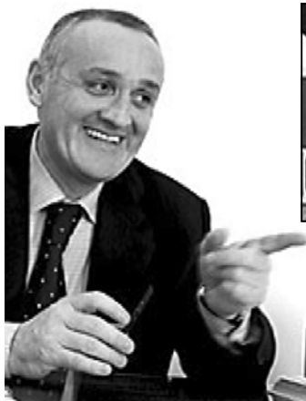
სასაფლაოზე კი აუფიქსირა, თუცა ბოლო მომენტში მან თავის დაღწევა მოახერხა.

ანექსიას ქართული პოლიტიკის გატარებას ბრალად აფხაზეთში უბრუნებდნენ. როგორც ამბობენ, სწორედ ამიტომ გაათავისუფლა ის არმიანმა ომის დასრულების შემდეგ. ეს მინისტრის პოსტიდან არა მარტო გაათავისუფლდა, ის იძულებული გახდა, აფხაზეთში დაეტოვებინა. ქართველ მარტინთან ლიდერმა ზურაბ სააშვილმა თავის დროზე „ახალ თობასთან“ განაცხადა, რომ არმიანს დავალებით, მისი მოკვლაც კი სცადეს, ის სოხუმის ერთ-ერთ