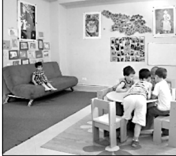
გამოყვანა მოუწია, ბავშვის ფსიქიკას ზიანი მიადგება.

განმარტვენი პარტიანი. მათი თქმით, იმ შემთხვევაშიც კი თუ შუა სასწავლო წელს მშობლებმა თანხის გადახდა ეერ შექმნა და ბავშვის საბავშვო ბაღიდან