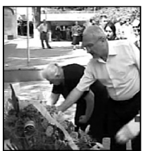
აფხაზეთში დაღუპულ გმირთა გემორიალს დასაფლავდა დღესაც გაცემის „არდავინების“ ნეკრობმა გმირგმირებით შეამკრა.

აფხაზეთში დაღუპულ გმირთა გემორიალს დასაფლავდა დღესაც გაცემის „არდავინების“ ნეკრობმა გმირგმირებით შეამკრა. დაღუპულთა დედაებთან ერთად გმირთა მოედანზე ევტერან მეთაურთა საბჭოს წევრებზე მივიდნენ.