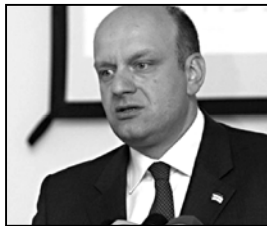
ოქმის დამყარების შესახებ მხარეებმა გაეროს გენერალურ მდივანს ბან კი მუნს ერთობლივი წერილით აცნობეს.

დამკვიდრებული პრაქტიკის შესაბამისად, დიპლომატიური ურთიერთობების დამყარების შესახებ ხელმოწერის შემდეგ, საქართველოს მხრიდან ოქმს ხელი ამ სახელმწიფოს საქმეებში დროებითაა რწმუნებულია ჯიმ ლიპევი მოანერა, საქართველოს მხრიდან კი საქართველოს მუდმივმა წარმომადგენელმა გაერო-სთან, საგანგებო და სრულუფლებიანმა ულჩამ ალექსანდრე ლომიაძემ.