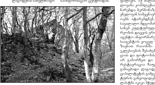
ლაგოდეისის სახელმწიფო საინფორმაციო ცენტრთან

ფილიყო. იქ ძალიან მნიშვნელოვანი კომპლექსი ფუნქციონირებდა. ბერძონურებში მნიშვნელოვან სამუშაოებს ატარებდნენ.