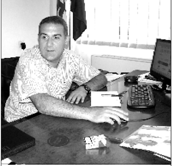
დეპუტატ ნუგზარ ნიკლაურს დახეული ჯინსები არ ადინიანებს

— არ ვიცი, შეიძლება, ვყოფილვარ, მონაწილეობა კი