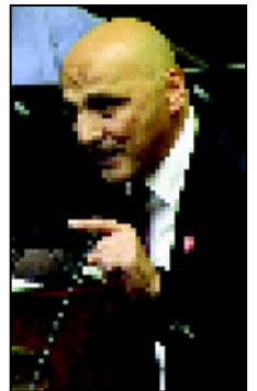
პირველმა სხდომამ სმაურით ჩაიარა

ჯონდი ბაღათური: „ღვინოში, დუღუკსა და ქალებში ხელისუფლება მილიარდებს ხარჯავს“ ა3.3