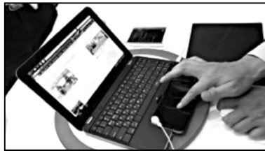
შინაზდა გენდა თვარება

გარდა ამისა, ტამილნადის შტატში ხშირია ელექტროენერჯის მიწოდების შეფერხება, რაც იმას ნიშნავს, რომ მოსწავლეები თავიანთი კომპიუტერული ვერ ისარგებლებენ ისე ხშირად, როგორც ეს ხელისუფლებისათვის იქნებოდა სასურველი. გარდა ნოუთუპიუსისა, შტატის ხელისუფლები სხვა დამირებულ ნივთებს, მაგალითად, საშარეულის მიქსურებსა და ყავის საფუკვევებს არიგებენ. სახელმწიფო სუბსიდების პროგრამის მოქმედების ფარგლებში მოხვედრილი ნაკლებად უზრუნველყოფილი ოჯახები ასევე უფასოდ მიიღებენ შინაურ პირუტყვს, მათ შორის, თხებას და ცხვრებს.