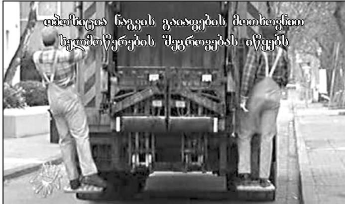
თბილისში ნაგვის გადასახადის მართვით ხელმძღვრების შეგროვებას იწყებს

ინგლისში მუხიამ და სახელები თბილისელებს დაუვიწყარი საჩუქარი გაუკეთეს, ხომლის წყალობითაც თბილისელები ახლა იოხევი და სამუქი მეტ თანხას იხიან ნაგავში. ყველაზე საინტერესო ის ახის, ხომ ნაგვის გადასახადი მომხმარებელი ქვეყნისთვის მიხედვით გამოიანგაჰიშება.