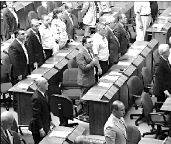
საპარლამენტო არჩევნები 2012 წლის შემოდგომაზე ჩატარდება. კონკრეტულ თარიღს პრეზიდენტი სააკაშვილი დანიშნავს. არჩევნებამდე ერთი წელია დარჩენილი, ამიტომ იქამდე ბევრი რამ შეიძლება შეიცვალოს, თუმცა, არსებული რეალობა იმის თქმის საშუალებას მაინც იძლევა, როგორ იქნება მომავალი პოლიტიკური შემოდგომა.

არადა, ზოგიერთმა სამი წლის შემდეგვე ვერ გაიგო, თუ რისთვის მოვიდა პარლამენტში, რის გაკეთება სურდა ან რა არ უნდა გაეკეთებინა. ისევე, როგორც წინა პარლამენტებში, რადიკალური მხედრობის დემუკრატების პოვნა ამ პარლამენტშიც მარტივია. ასეთების საქმიანობას მოსახლეობა რომ არ იცნობს, ერთია, მაგრამ, გასაოცარი ის არის, რომ მათ საკუთარი კოლეგების ნაწილიც არ იცნობს. ამის მიუხედავად, აქტიურებაც და პასიურებაც პოლიტიკაში დარჩენა სურთ, რადგან სკამს მაინც სულ სხვა ხიბლი აქვს.