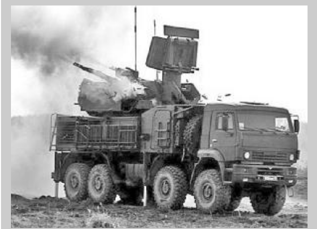
რუსეთმა არაუზ 20-ზე მეტი სარაკეტო-საჰაერო კომპლექსი „პანსირ ს-1“ მიჰყიდა

„ინტერფაქსის“ წყაროს მონაცემების თანახმად, ეს საბრძოლო მანქანები მიენოდა რუსეთის ფედერაციასა და ერანს შორის კონტრაქტების ფარგლებში, რომლის დეტალებსაც არ ახმაურებენ. არაოფიციალური მონაცემებით, იგი დაიდო 2012 წელს, მისი ღირებულება შეფასებულია 4,2 მილიარდ დოლარად. კონტრაქტში ასევე შედის საბრძოლო შევლემფრენებისა და შემტევი თვითმფრინავების მიწოდება.