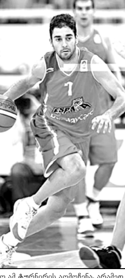
ტო მ მტურნირის აღმოჩენა, არამედ ერთ-ერთი საუკეთესო კალაბურთელი.

ალბათ მთელს ევროპის ჩემპიონატზე გამორჩეული კალაბურთელი. მეტიც, უცხოელანტელებით გამოჩნეული. თუ მისი ზოგადი თანხაგუნდით მოედასნე ფრანგებთან, პაუ იდგა და ყოველგვარი დაღლის გარეშე „პატარა ბავშვებს“ ან ბურთს უგდებდა კალაბო, ან თანავადუნელს ამარაგებდა საჭირო პასებით. დაცვაში კი მართლაც ფინალშიაღდური იყო. ალბათ მარტო ნავრო ვერაშედეგ გახდებოდა და მთლიანად ესპანეთის ნაკრები ჩემპიონობას ვერ შენდებოდა, უფროსი გავლილი გუნდი რომ არ ყოფილიყო. სწორედ მხოლოდ მაკვერნიის მანერეული მანერეული და ფრანგებთან მატჩში და მირიკი ტიტულიც გრავდა. იმსახურებს ნამდვილად!