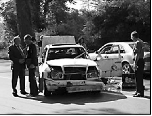
ფისი ისეთივე მღელვარე გამოდგა, როგორი მღელვარებაც მის მიერ საკადრო ნქმნდამ გამოიწვია.

როგორც ბანკში ამისხნეს, საუბარია 2 212 ლარზე. აქედან 2 008 ლარი არის ავგისტის დღე, რომელიც 15 სექტემბერს წარდგენილი დეკლარაციების შედეგად დამუქისრა, 129 ლარი ქონების გადასახადი და 76 ლარი რალაც არაკლასიფიცირებული დავალიანება. ამ ყველაფრის გადახდას ზღადავირებდა, მაგრამ დღეს უკვე ინკასო დაამ-