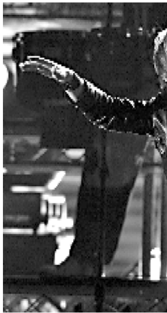
მართლებებისკენ მოუწოდებდა, სადაც ჯგუფთან „არქტივ მანქ“ დაიარსდა. ასევე ნიშნობდნენ იორკს, რომელიც წლის საუკეთესო ალტერნატიული მუსიკის ალბომი.

იორკს მეგობრებთან ერთად დაგროვილმა პროტესტის გრძობამ სტილის რადიკალურად შეცვლისკენ უბიძგა, რაც შემდგომში ალბომებს „კიდ ა“ და „ანენზია“ (2000-2001) სახით წარმოვიდა მუსიკალურ სამყაროს. რედიოჰედს ხელისუფლების საზღვრების გადარღობამ, რაც ელექტრონიკის, ჯაზისა და კლასიკური მუსიკის სინთეზში გამოიხატა, კრიტიკოსთა აღიარება მოუტანა. თუმცა, მათ გვერდით იყვნენ ისინიც, ვინც რედიოჰედს ადრეულ სტილს იზიარებდა და საყვარელ ჯგუფს ალტერნატიული მუსიკის მი-