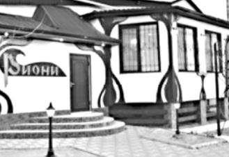
საქმე ისაა, რომ ლავროს ნარმო-სხსაც ცოტა ხანი დააჩვენეს. 2007 წელს დაიწყო. მთლიანად, „რიონის“ ქსელი კი სააკაშვილმა 2005 წელს დაარსა...