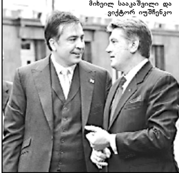
მიხეილ სააკაშვილი და ვიქტორ იუშენკო