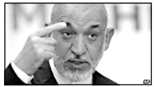
ექვსიანილები ერთი კვირის წინ დააკვირეს. ოფიციალური პირების თქმით, ექვსიანილებმა მოზარდები გასულ თვეში გაიარეს.

მამალის თქმით, დაკვირვებულს კავშირი ჰქონდათ ავა კაიდას და პავსტანის დასავლეთით, ვაზირისტანის პროვინციაში ზაჩირეულ პაკანის დაჯგუფების წევრებთან.