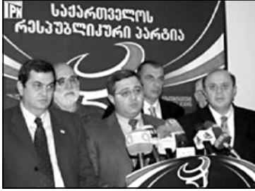
თვის მოქალაქეობის სამართლებრივად აბსურდული და პოლიტიკურად გაუგებარი ჩამორთმევა, მისი ვაჟის მეგობრის დაკავება, სატელევიზიო ინტერვიო მანამდე ხელისუფლების დიდი მეგობრისა და ქველმოქმედის წინააღმდეგ, ივანიშვილის რუსული ინტერესების გამტარებლად გამოცხადება, ბანკ „ქართუს“ წარმომადგენლებს წინააღმდეგ განხორციელებული დღევანდელი მოქმედებები, ბიძინა ივანიშვილის დაცვის-

— დღეს სრულად ნათელია, რომ საქართველოს ხელისუფლება დანაშაულებრივად დომინანტის გზას დადგა და საკუთარი მოქმედებით ქვეყანა მორიგი დამახურობისკენ მიჰყავს. რესპუბლიკური პარტია ერთმნიშვნელოვნად აცხადებს, რომ სააკაშვილისა და მისი გარემოცვის სურვილი — ბიძინა ივანიშვილი დანაშაულებრივად გზით ჩამოაშორის პოლიტიკურ პროცესს, არის კიდევ ერთი მხედლობა, მოკლას ჯანსაღი პოლიტიკური პროცესი და ქვეყანას უმბიძგოს არჩევნის წინაშე აყენებს. ბიძინა ივანიშვილის