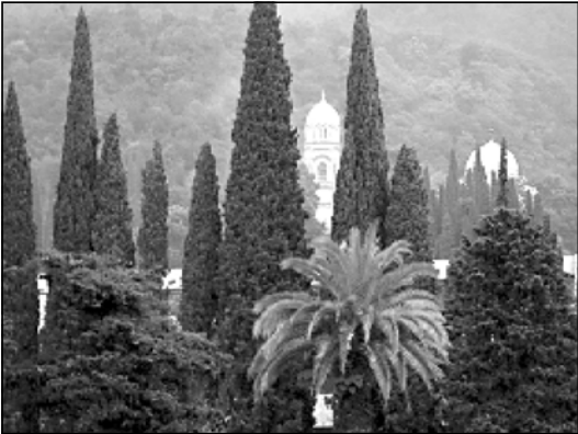
ჩვენ შთავაზება, ბუნებრივია, არ მივიღებ.

აფხაზეთში დომინოსი მსოფლიო ჩემპიონატი დაიწყო. ჩემპიონატი აფხაზების სიაშიაქვს დენის გარეკუთხა გახსნა. ამ დონისიბებისთვის აფხაზები დიდი ამბიო მთავრები. მას დიდი მოვლენა უწოდებს და თქვას, მაღე სპორტის სხვა სახეობებშიც ჩაატარებოთ მსოფლიო ჩემპიონატის. დომინოსი აფხაზ ჩემპიონატებმა კარგად იცოდნენ. ხელისუფლებამ პროტესტიც კი გამოახატა, მაგრამ ვინ ფიგურირებს აფხაზეთში დიდი ტურნირი დაიწყო. აფხაზებმა, სხვათა შორის, ამ ჩემპიონატზე დასრულება გეგნივს.