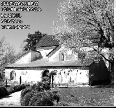
ფოთისა და სოხის მითარქოლოგიკი გრიგოლოჩის კართინაძის 2009 წლის ივლისიდან მიმდინარეობს...