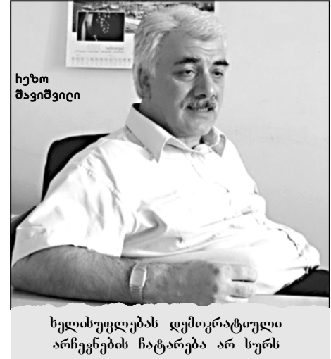
ნელისუფლების დემოკრატიული არჩევნების ჩატარება არ სურს

— ასეთი ფრთხილი პირველი არ არის ნათქვამი, რამდენიმე თვის წინ კლავტონმა კლიენტმა განაცხადა ამის შესახებ. ხელისუფლება დემოკრატიული უნდა იყოს გადაარტყული და პროცესი სერიოზულად დემოკრატიული არჩევნება. სამხრეთი ხელისუფლების დემოკრატიული არჩევნების ჩატარების სურვილი არა აქვს. მე ვფიქრობ, ამ მიმართულებით ბრძოლა ჯერ კიდევ დასრულებული არ არის.