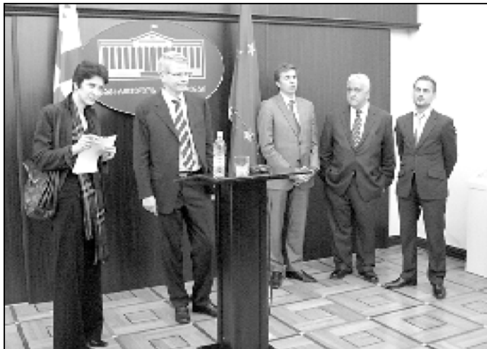
გორც „საარჩევნო კოდექსში“, ისე სხვა საკანონმდებლო აქტებში ასახვის მნიშვნელობასაც.