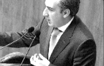
ნაალდგეფო დებულებებსაც შეიცავს. მთავრობა ერთი მხრივ აცხადებს, რომ საქართველოს ეკონომიკის პოზიტიუ-რი მაკროეკონომიკური პარამეტრები გამოწვევებს დღეს მსოფლიოში არსე-ბული კაპიტალის მოზიდვას, ახალი ინვესტიციების განხორციელებას და, მეორე მხრივ, ნათქვამია, რომ მსოფ-ლიოს შემდგომი ინვესტიციების შემ-ცირებას გამოიწვევს. ჩანსების თნით, მთავრობა საუბრობს საქართველოს კონკურენტუნარიანობის სისუსტეებ-ზე, როგორცაა ბაზრის სიმცირე და რუსეთის ფაქტორი, მაგრამ დაა-ცინებდა ისეთი მახასიათებლები, რო-გორცაა: კონკურენტის შეზღუდე-ლი არაა, საკრედიტო რესურსები-სადმი ნაკლები ხელშისანდობობა, ინო-ვაციური ეკონომიკის არარსებობა, გა-ნაყოფებისა და სამწარმეო გარემოს შორის სუსტი გავიძირი და კიდევ მრავ-ალი სხვა, რომლის გამოც მსოფლიო ეკონომიკური ფორუმის რეიტინგით სა-ქართველო ეკონომიკის კონკურენტუ-ნარიანობის მიხედვით აუსტსიადერი ქვეყანაა.