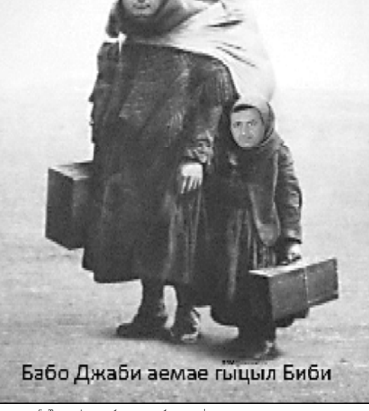
Бабо Джаби аемае гыцыл Биби

მისამართი: ქ თბილისი, ლუბანავლის ქ №50, მე-3 სართული. ტელეფონი/ფაქსი 2-94-001 ვებ-გვერდი www.atb.ge E-mail: axtaoba@mail.ru რედაქციაში შემოსული მასალები არ რეგონდნ და ავტორებს არ ურეგონდნ. რედაქციაში თანხმობის გრემე გაწვით დაბეგდელი მასალების, სურათების და სარეკლამო განცხადებების სრული ან ნაწილობრივი გამოყენება ავტომატულია. სურათში გამოყენებული მასალების ხელახლებულ პასუხს ავტომატურად უფლებები დაცულია.