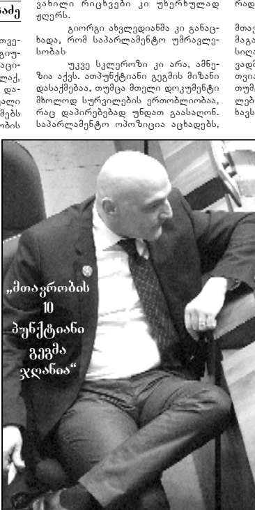
„მთავრობის 10 პუნქტანი გეგმა ჯღანია“

შალაფა ვახიძე რამდენიმე კვირაა, საქართველოს მთავრობის თავისი სტრატეგიული ათაშუნქტანი გეგმა მოდერნიზაციის და დასაქმებისათვის ქალაქქალაქ, სოფელ-სოფელ, უწყება-უწყება და-აქვეს, თან გვირმუნენს, რომ მომავალი 5 წლის განმავლობაში დაგეგმიწქქე და აგეგეგეგეგეგე. ამჯერად, მთავრობის გეგმები პრემიერ-მინისტრმა ნიკა გილაურმა საპარლამენტო ტრიბუნაზე დაგეგეგეგეგე და ამ თე-მაზე საკანონმდებლო ორგანოში დედატეტი გაიმართა. ეს იყო დე-დატეტი დედატეტი. მართა-ლოა, ნიკა გილაური უაზრო ფრა-ზების და ციფრების გავრცელე-ბაში, ნეოპოტიზმა და არაპრო-ფესიონალიზმში დადადადადა-ლეს, თუმცა რა, ამიო მთავრობა უკეთ ამუშავდება? ვიცე-სპიკერ-მა პაატა დავითიამ მინისტრე-ბისადმი უნდობლობის გამოცხა-დებაც მოითხოვა, მაგრამ საპარ-ლამენტო უმცირესობას პარლა-მენტში მერიდული უფლებები აქვს და ამინდს ვერ ქნის. ნიკა გილა-ურმა დაპირებების მორიგი კას-კადი წარმოგივდინა, თუმცა, ლევერ ვუხვების სიტყვებით რომ თქვით, ეს საზეპორიების გარე-ობრება უფრო იყო.