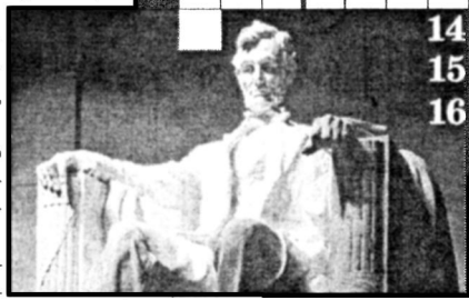
14 15 16