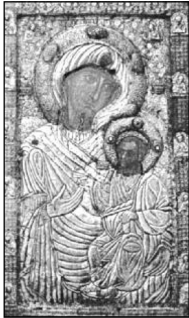
მთელ საქართველოს შეეწიოს ივერიის ღმერთმშობლის ხატის მადლი