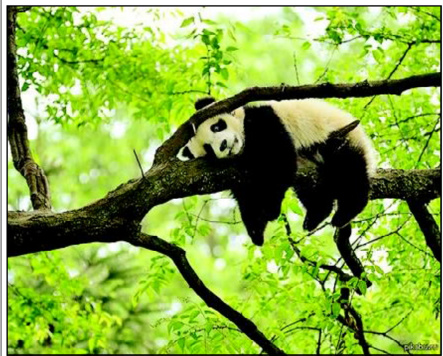
მისაბ ორიდან ერთ-ერთი პანდა, რომელსაც მარტში ჩინეთიდან სამხრეთ კორეაში გაგზავნიან. საგულსხმოა, რომ ეს ცხოველები კორეას ჯერ კიდევ 1994 წელს გადასცეს, მაგრამ მალევე გლობალური ეკონომიკური-ფინანსური კრიზისი დაიწყო, პანდების შენახვა გაჭირდა და ისინი უკან ჩინეთში დააბრუნეს. ამ ჯერზე ჩინელი პანდების კორეაში „ასიმილირების“ ეს მეორე ცდაა.