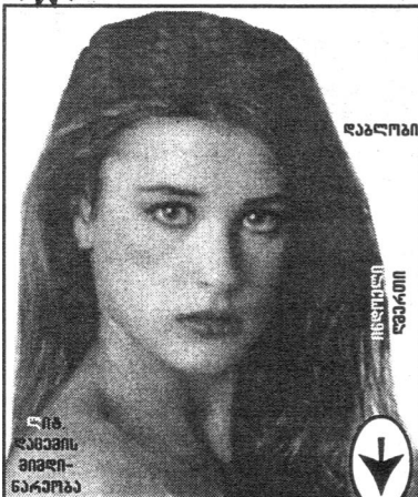
წიგ. ჯანაშიას მიხედვით ნარკოზა