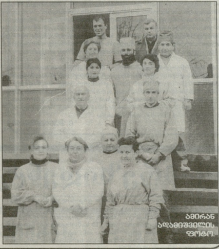
პრეზიდენტი ივანე გაბიაშვილი (მეორე რიგის მესამე ადგილიდან) საავადმყოფოში.

უფრო, იმისთვის, რომ ქართული საავადმყოფოში მუშაობის შესახებ, რომელიც ავადმყოფის საავადმყოფოში მუშაობის შესახებ, რომელიც ავადმყოფის საავადმყოფოში მუშაობის შესახებ.