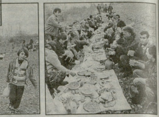
გიორგობა, ძველი. სოფელი ძველი. ხანის კონსტრუქციის ფოტო.