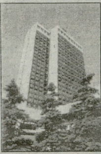
საქმეთა სამინისტრომ "არასამხელ მშობლებს" გამო სტოიანებს ბონის ნაყვალად