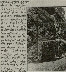
1883 წლის რეკონსტრუქციის მიზნით აღადგინეს ადრეა თბილისური კონკა...