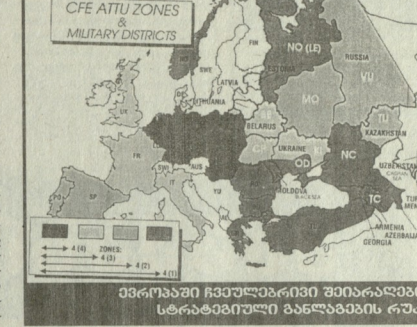
შეიარაღებული შეიარაღების შეხიზნების რუკა