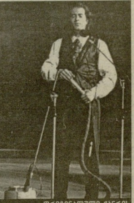
ორბინეცალი ბარბის მინეზოპაძის მთა ზანბარბა