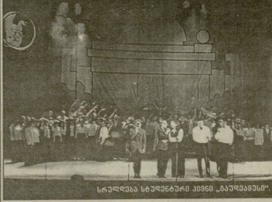
სრულზე სტუდენტური კონკრეტის „გაუბარებო“

ქმელბაძის ნღებმა თითქოს დაგვიწვივა ტრადიციულად სტუდენტური დღეები, რომელიც ყოველ გაზაფხულს იმართება. საქართველოს უმაღლეს სასწავლებლებში და გადამზრდებოდა ხოლმე ღირსსახსოვარ ფესტივალებსა თუ სტუდენტობაში საუკეთესოთა ასპირანტებში საუკეთესოთა შორის საუკეთესოთა გამოხატულება.