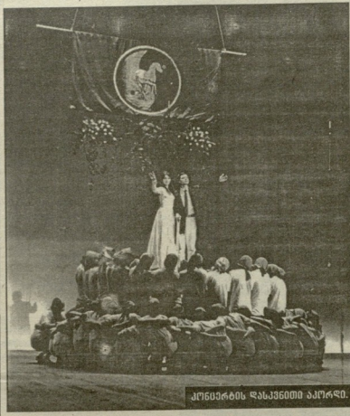
კონკრეტის მხარეში აკორდო