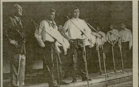
ქარბული საზსარი სიმღერების ანსამბლი „მინეზო“