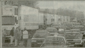
საპროტოკოლო ადვოკატების კონსულტაციის შემდეგ, ადვოკატების კონსულტაციის შემდეგ, ადვოკატების კონსულტაციის შემდეგ...