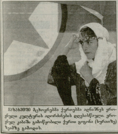
საზაპროში მცხოვრებმა ქართველმა ადვოკატმა ერთ-ერთმა კულტურის აღორძინების დღესასწაული. ერთ-ერთი კაბაში გამოწვეული ქართული გოგონა (სურათზე) ზემოთ გამოდის.