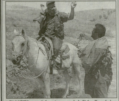
დაბაღუბო ვითარება ტყვეობის საშიშროებას. თქ. სადაც ყველაზე უფრო ვერ გავიდა, მთავრობის ძალების შეზღუდვა ცხელი დატყვევების...