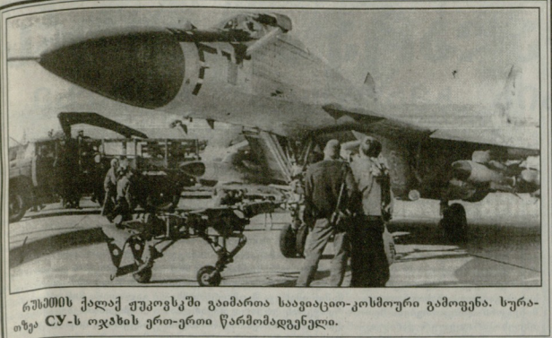
რუსეთის ქალაქ ვუოვსკოში გაიმართა საავიაციო-კოსმოსური გამოფენა. სურათზე CY-ს თვითმფრინვების ერთ-ერთი წარმომადგენელი.