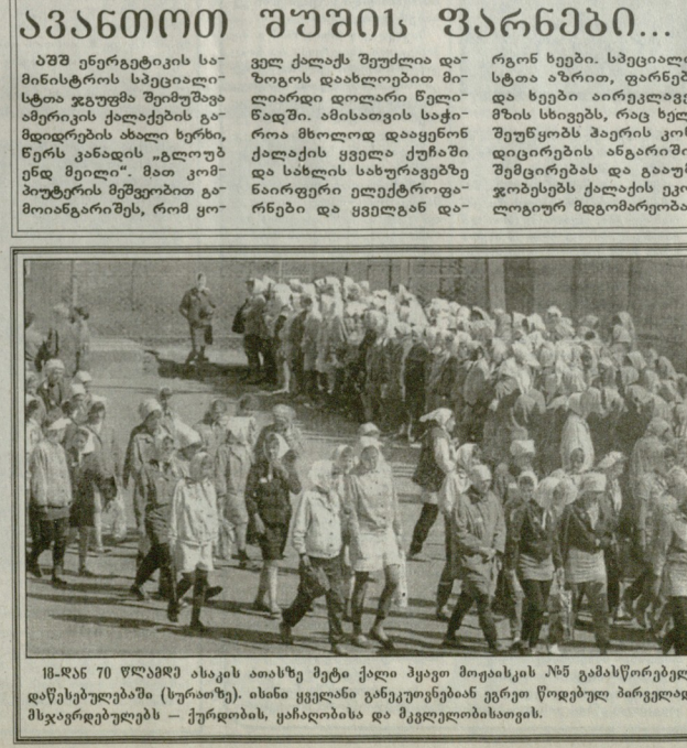
მ. შან 70 წლისა და 70 წლის იაპონური მეთი ქალი ჰყავთ მთავრობის 150 გამასწორებელ დანერგვებში (სურათზე). ისინი ყველაზე განვითარებული გერმანიის წარმომადგენელი მწიგნობრები — ქართველი, იაპონელი და მკვლელობისთვის.