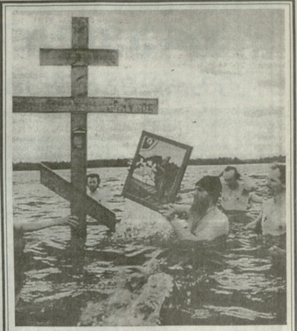
ლატვიაში (რუსეთი) ფართოდ აღინიშნება ტისვინის დღისმშობლის ხატის დღესასწაული.