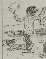
— შენ ბავშვისი ღმერთი, რა ხანია ვაგვით თვალით არ მინახავს...