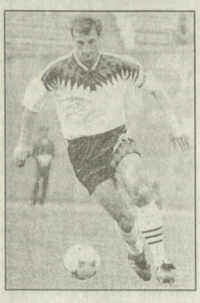
გილი - სარკოვის სიკოლი, თავისი მსხველი, პირველი ლიბა...