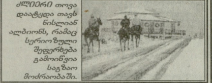
ქლირი თვალი დაბრუნდა თავის ნისლიან ალბინოს, რამაც სერიოზული შეფერხება გამოიწვია სავაზო მოძრაობაში.